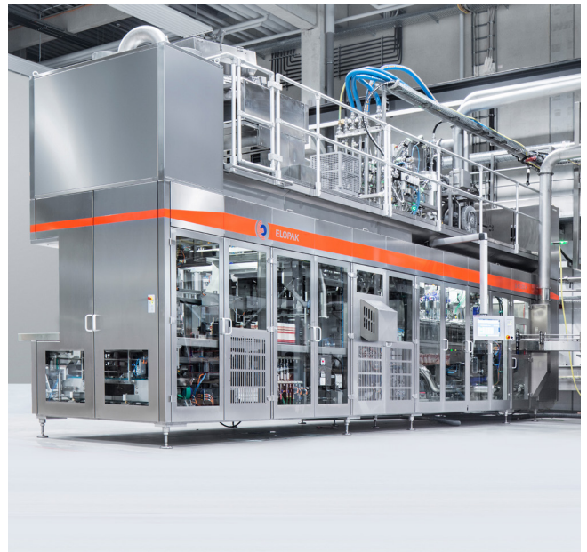
Die aseptische Abfüllanlage E-PS120A von ELOPAK verspricht Füllleistungen bis zu 12.000 Kartons pro Stunde und ermöglicht das Abfüllen von Flüssigkeiten mit hoher oder niedriger Viskosität in Kartons mit unterschiedlichen Designs, Größen und Verschlüssen.

Ergebnis: Verbesserung der Engineering-Workflows, Verbesserung der Datendurchgängigkeit, Erhöhung von Datenqualität und Prozesssicherheit zur Beschleunigung von Entwicklung und disziplinübergreifender Zusammenarbeit