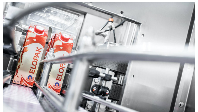
Als einer der weltweit führenden Hersteller beliefert ELOPAK Unternehmen der Lebens- und Genussmittelindustrie mit kompletten Verbundkarton-Verpackungssystemen für flüssige und pastöse Nahrungsmittel.

Die rund 70 Entwicklungsingenieure am ELOPAK-Standort Mönchengladbach nutzen für die mechanische Konstruktion SOLIDWORKS und für die Planung der elektro- und fluidtechnischen Teile der Füllmaschinen EPLAN Electric P8, EPLAN Fluid und EPLAN Pro Panel. Für die Ablage aller produktrelevanten Daten verwendeten die Konstrukteurinnen aller Disziplinen in der Vergangenheit ein PLM-System.