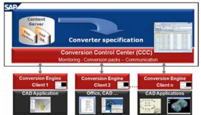
Schema der CIDEON Conversion Engine für SAP