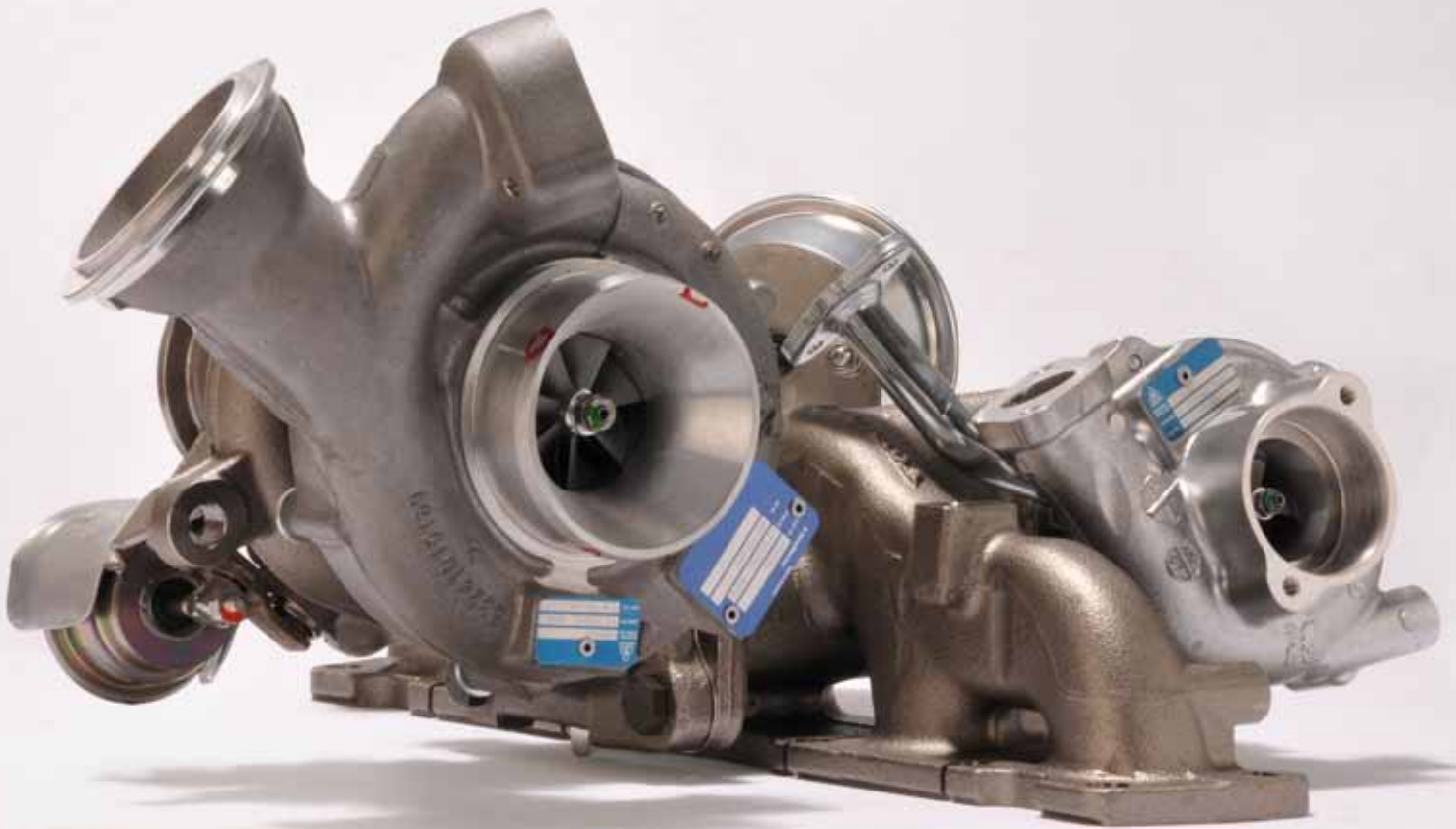
„R2S“ für Volvo D5 2,4 | Diesel Motor

Zusätzlich werden Dokumente, die nicht freigegeben sind, mit einer Art Wasserzeichen versehen. So wird zum Beispiel eine Zeichnung im Status „Pre-Released“ mit dem Aufdruck: „Preliminary – not for Manufacture“ bestempelt, damit deutlich wird, dass nach dieser Zeichnung nichts gefertigt werden darf.