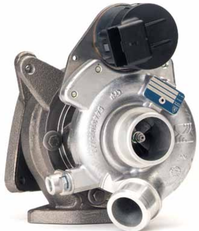
Turbolader für PKWs