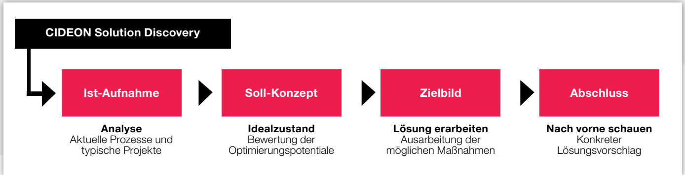
Kernphasen des CIDEON Solution Discovery